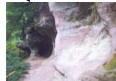
Naturhöhle „Großes Loch“