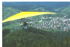
Drachenfliegen von der Teufelsmühle