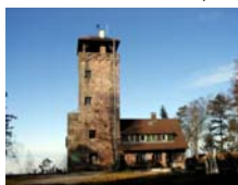
Teufelsmühle: Aussichtsturm und Restaurant