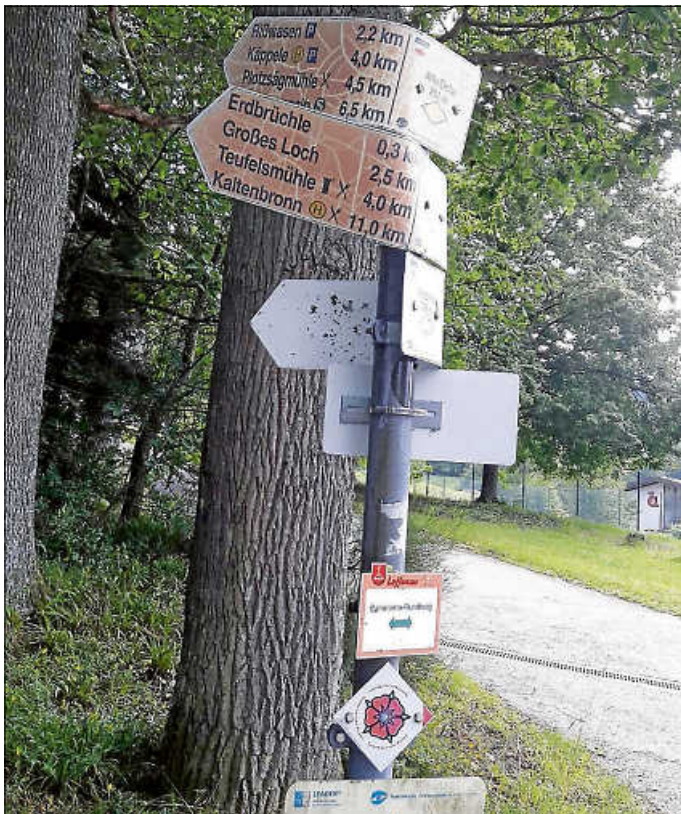
Mutwillig beschädigter Schilderbaum am Weg zum Dachsfelsen.

Auch vor der freien Natur macht die Zerstörungswut keinen Halt. Dies musste die Gemeindeverwaltung zu Beginn der Woche erneut feststellen, als sie von einem Loffenauer Bürger diese Bilder erhalten hat. Dieses Mal ist der Schilderbaum mit dem Standortnamen „Alte Eiche“ am Weg zum Dachsfelsen dem Vandalismus zum Opfer gefallen. Die unbekanntenen Vandalen schlugen vermutlich vergangenes Wochenende zu und verbogen die einzelnen Wegweiser mutwillig. Vermutungen, welchen Hintergrund die Tat haben könnte, gibt es nicht. Der kommunale Bauhof versucht nun, den Schilderbaum wieder herzurichten. Ob die einzelnen Schilder allerdings wieder in ihren Ursprungszustand zurückgebogen werden können, ohne sie weiter zu beschädigen, ist fraglich. Im schlimmsten Fall müssen die Schilder ganz ersetzt und von Steuergeldern getragen werden. Die Verwaltung hat entsprechend Anzeige erstattet.