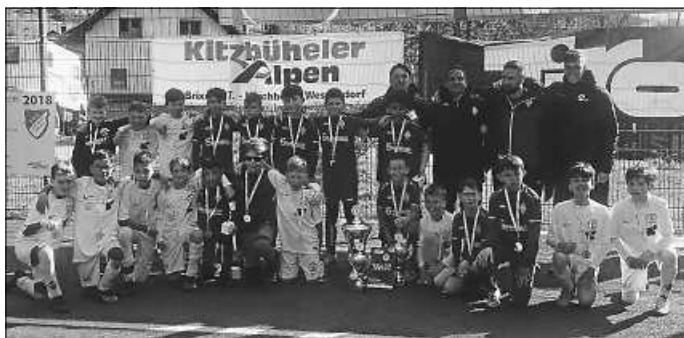
Die Finalisten des Loffenauer Turniers vom SV Böblingen (blaues Trikot) und SV Vaihingen (weiß).

Und dann noch ein ganz spezieller Dank an die „Schneeschipper“, die nach dem Wintereinbruch am Samstag spontan zur Schaufel gegriffen haben und den Sportplatz vom Schnee befreit haben.