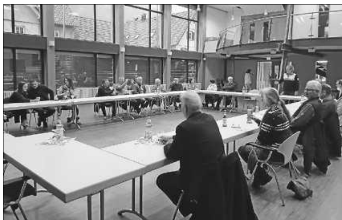
Reges Interesse an der Mitgliederversammlung.