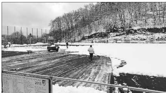
Schneeschippen als „erste Disziplin“ des „Aktivtags“.

So sieht Zusammenhalt in einem Verein aus! Als in der Nacht zum 9. April 2022 plötzlich gut 20 cm Neuschnee in Loffenau fielen, schien es so, als müssten der „Aktivtag“ und das „Cordial-Quali-Turnier“ auf dem Sportplatz am Wochenende ausfallen. Doch schon um 8:30 Uhr standen rund 30 freiwillige Helfer mit ihren Schneeschippen und Räumgeräten auf dem Platz und sorgten mit ihrem spontanen Einsatz dafür, dass beide Veranstaltungen erfolgreich durchgeführt werden konnten. Der TSV und der Förderverein Jugendfußball bedanken sich nochmals ganz herzlich für diese unvergessliche Aktion!