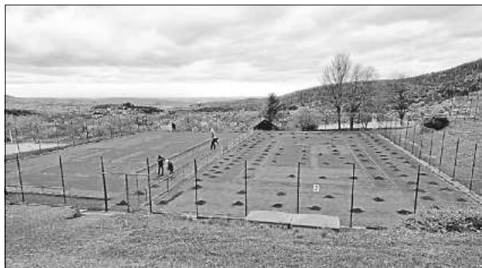
Arbeiten auf den Plätzen haben begonnen.

die Anlage aus dem Winterschlaf erwecken. Vielen Dank schon heute an alle, die uns an diesem Tag unterstützen werden.