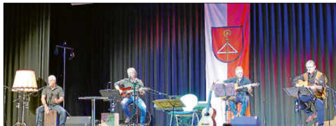
Erster Auftritt von „Nuff the Rock“ nach zwei Jahren coronabedingter Pause.