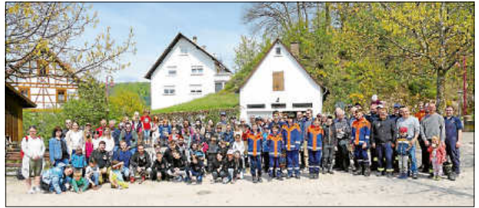
Fast 100 Bürger*innen wohnten der diesjährigen Bach- und Waldputzete bei.

Auch die Bach- und Waldputzete am Samstagvormittag war ein voller Erfolg. Knapp 100 Bürgerinnen und Bürger haben sich an diesem herrlich warmen Vormittag vorgenommen, unseren schönen Ort von Müll und Unrat zu befreien. Um 9.30 Uhr ging's los. Bürgermeister Burger koordinierte die Gruppenaufteilung sowie die einzelnen Laufstrecken im Ort. Gesagt getan. Äußerst motiviert machten sich die Kleingruppen auf den Weg. Überraschend in diesem Jahr war, dass deutlich weniger Müll aufgefunden wurde, als in den vergangenen Jahren und dass Loffenau einen sehr gepflegten Eindruck macht. Nach zweieinhalbstündiger Arbeit trafen sich die Teilnehmer*innen wieder am Feuerwehrgerätehaus, wo sich Bürgermeister Burger bei der Bürgerschaft für ihr Engagement bedankte. Zum Abschluss gab es für alle Fleischkäse im Weck und ein Kaltgetränk. Die diesjährige Bach- und Waldputzete war ein voller Erfolg!