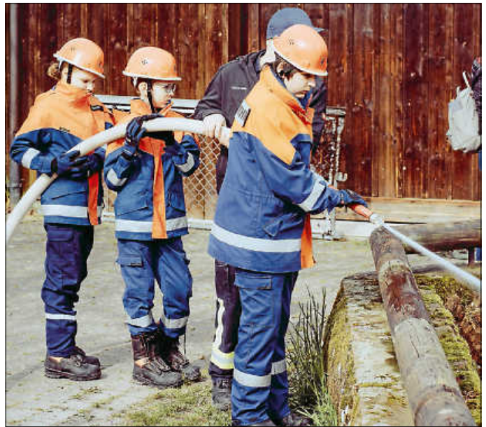
Mitglieder der Jugendfeuerwehr reinigen den Sägmühlteich.