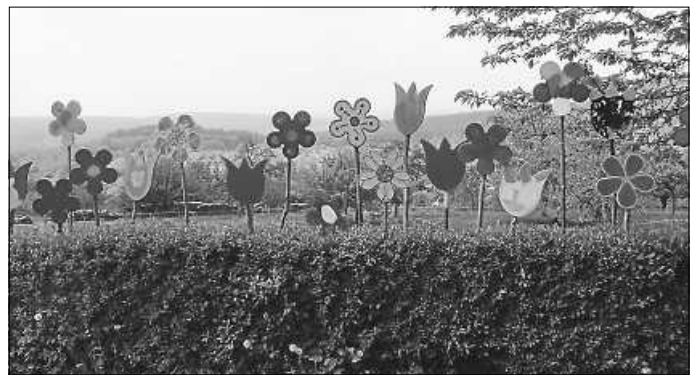
Blütenpracht im Jubiläumsjahr 2022