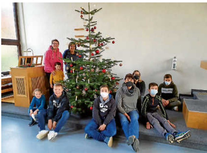
Kinder vor dem geschmückten Weihnachtsbaum.

Weitere Informationen finden Sie unter www.nak-loffenau.de .