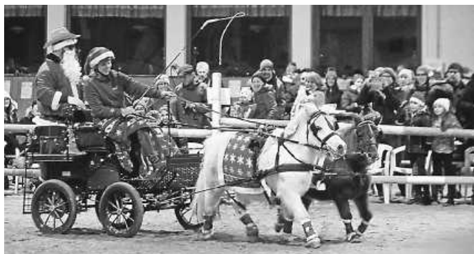
Einfahrt des Nikolaus.

Am Ende folgte noch die Vorstellung einiger Pferde und, verbunden mit großem Dank für ihre treue Freundschaft, erhielten auch sie vom Nikolaus ihre Bescherung in Form von Karotten, Äpfeln und anderen Leckerli.