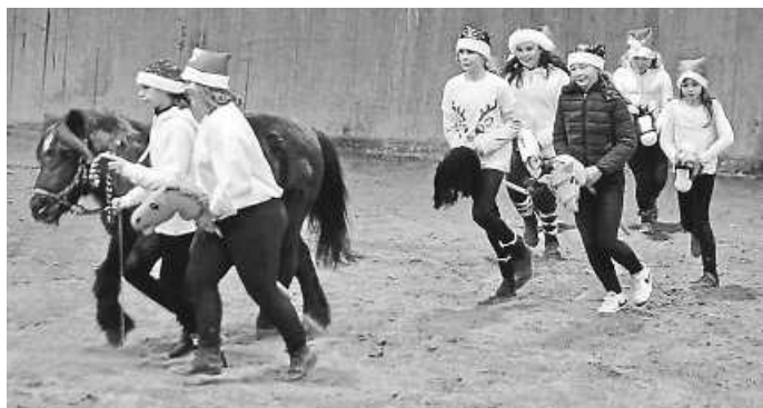
Steckenpferde mit Gizmo.