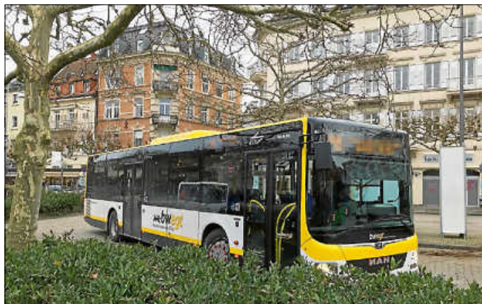
Regiobus in Baden-Baden.

Die aktuellen Fahrpläne für die Linien 244 sowie X44 können ab sofort kostenfrei bei Herrn Braun im Bürgerbüro mitgenommen werden. Die ausführliche Pressemitteilung der Karlsruher Verkehrsverbund GmbH (KVV) kann weiter auf der Homepage der Gemeinde Loffenau nachgelesen werden. Die Gemeindeverwaltung bittet entsprechend um Beachtung!