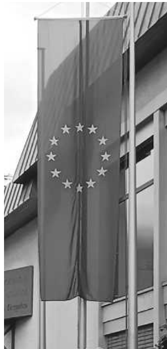
Die Europaflagge: ein Symbol für grundlegende Werte

Aus Anlass des Europatages wurden am vergangenen Dienstag bundesweit die Dienstgebäude aller Behörden und Dienststellen des Bundes entsprechend mit der Europaflagge beflaggt - ein Symbol für grundlegende Werte.