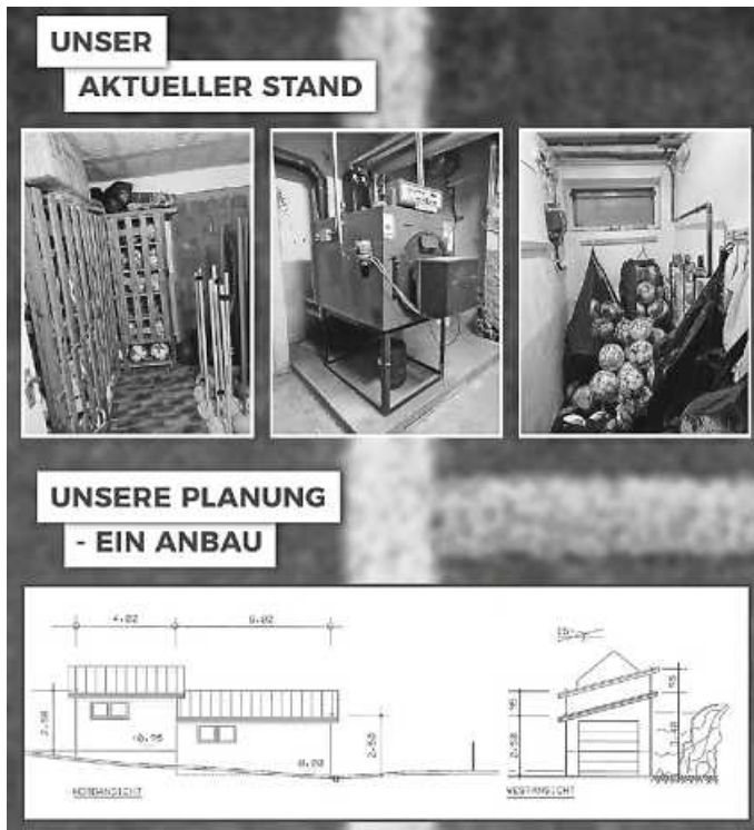
Plakat: TSV Loffenau