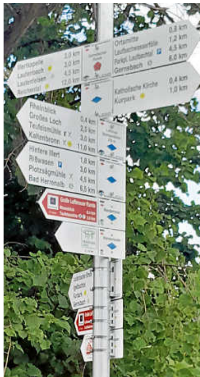
Wegweiserstandort nach Austausch der in die Jahre gekommenen Schilder.