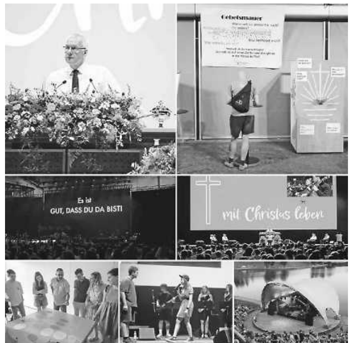
Jugendtag 2023 in München

Kurze Berichte und Bildergalerien zu den Hauptveranstaltungen des Jugendtags gibt es auf der Jugendtags-Webseite unter www.sjt2023.de/aktuelles