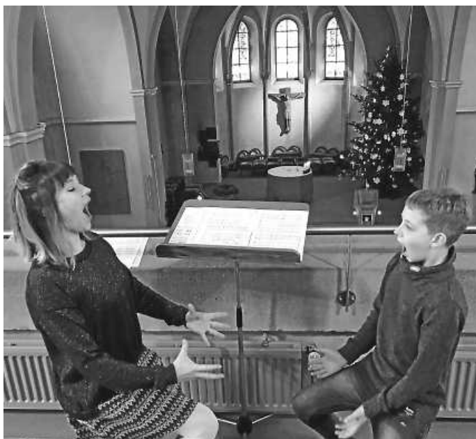
Musikalischer Hochgenuss am Dreikönigstag.