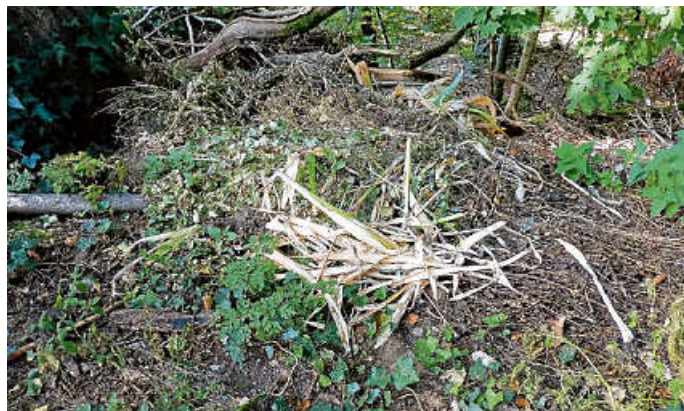
Erneuter Fall von illegaler Entsorgung von Grünschnitt im Loffenauer Wald, nahe der „Alten Straße“.

Fahren Sie Ihre Gartenabfälle bitte zur nächsten Kompostieranlage! Loffenau befindet sich in der glücklichen Lage, mit der Entsorgungsanlage in Gernsbach eine Grünschnittstelle ganz in der Nähe zu haben. Die Fahrt dorthin muss in Kauf genommen werden können. Nur, wenn jeder seinen Müll fach- und sachgerecht entsorgt, können wir von einem sauberen und gepflegten Orts- und Waldgebiet profitieren.