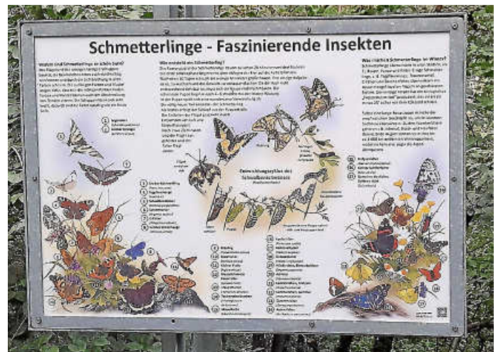
Infotafel „Schmetterlinge - Faszinierende Insekten“

In der vergangenen Woche hat der Gemeindebauhof die Informationstafeln am Pfarrberg erneuert. Diese wurden seit der Gestaltung der Anlage auf dem Pfarrberg im Jahr 2006 nicht mehr ausgetauscht und sind daher sichtlich in die Jahre gekommen. Nun war es höchste Zeit, die Tafeln zu erneuern, damit sie naturbegeisterten Wanderern und Besucherinnen und Besuchern, die nach Loffenau kommen und unseren schönen Ort erkunden, wieder in einem schönen, gepflegten und vor allem leserlichen Zustand zur Verfügung stehen. Vier von fünf Tafeln wurden getauscht, die fünfte wird in den kommenden Tagen geliefert und kommt dann ebenfalls an ihren neuen Platz.