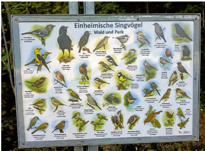
Infotafel „Einheimische Singvögel - Wald und Park“