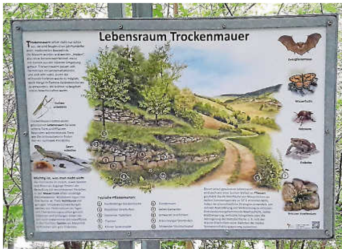
Infotafel „Lebensraum Trockenmauer“