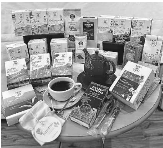
Auszug aus unserem Sortiment

Als besonderes „Schmankerl“ gibt es den ganzen Oktober über 10% Rabatt auf alle Teesorten!