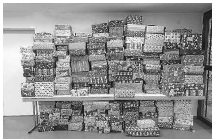
Die verpackten Geschenke.