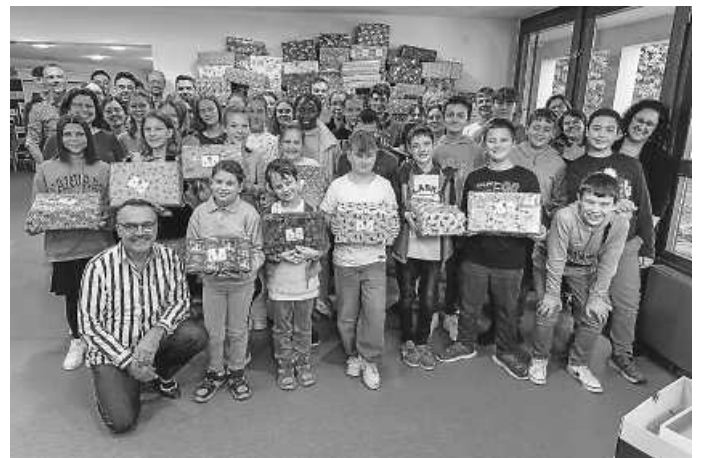
Die Kinder und Jugendlichen nach getaner Arbeit.

Ein herzliches Dankeschön an alle Helfer und die vielen Spender, die so zu einer großen Weihnachtsfreude für Kinder in Osteuropa beitragen werden.