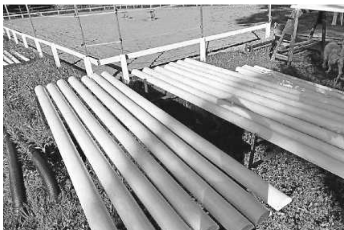
Neue Umrandung des Reitplatzes