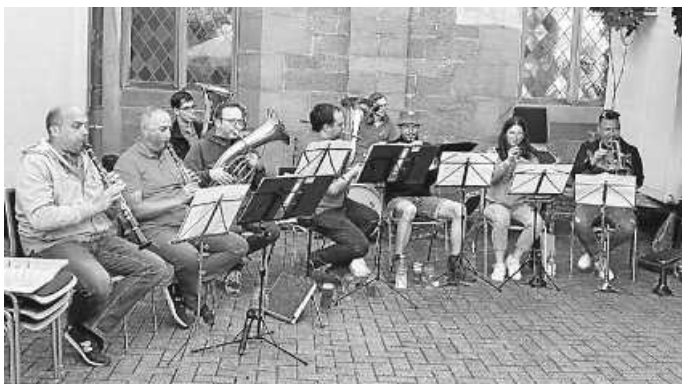
Musikalische Überraschungsformation - ein spontaner Zusammenschluss von Musikern der Kapellen Ottenau und Loffenau.

Nonstop ging es weiter und die Kapelle des Musikverein Ottenau unter der musikalischen Leitung von Holger Bronner sorgte mit bekannten Melodien für Stimmung im Publikum. Zum Abschluss wurde die Stimmung nochmals richtig angeheizt durch eine spontane, musikalische Überraschungsformation (Musiker/innen aus den Musikvereinen Ottenau und Loffenau), organisiert und unter der Leitung von David Gräßle.