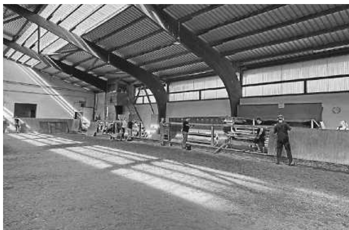
Abriss der Bande in vollem Gange

Die Vorstandschaft des Reit- und Fahrvereins möchte sich an dieser Stelle auch nochmals bei den zahlreichen Spendern für ihre Unterstützung und bei allen Gästen für ihren Besuch bedanken. Nicht zu vergessen die erfreulich aktive Vereinsjugend, die uns mit viel Engagement, Freundlichkeit und Freude im Umgang mit den Pferden stets hilfreich zur Seite steht und uns damit sehr unterstützt.