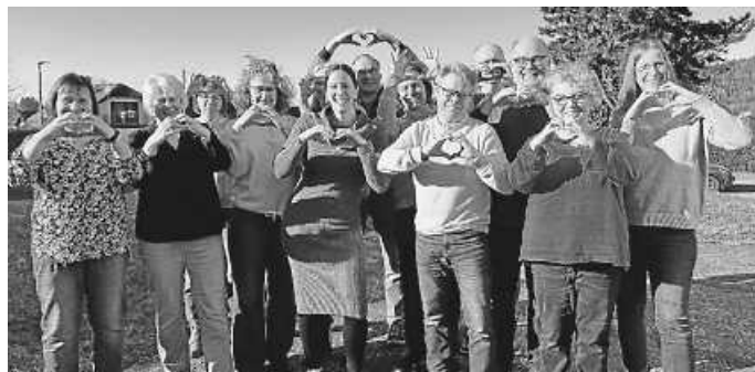
Chorlibris am Orga-Tag