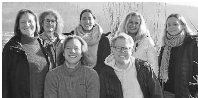
Das erweiterte Vorstandsteam