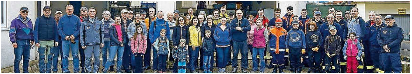
Gruppenbild Bach- und Waldputzete