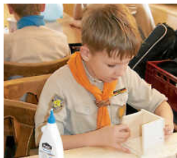
Ein Sperrholzkästchen entsteht.

Die kalte Jahreszeit haben unsere Gruppen zum Basteln genutzt. Eine Gruppe hat sich dabei mit Zahnradantrieben beschäftigt. Nun sägten sich die Kinder mit der Laubsäge die Teile für eine kleine Kiste zurecht. In diese Kiste bohrten sie seitlich zwei Löcher. Durch diese verlief die Achse für einen Kurbelantrieb. Auch von oben bohrten sie noch ein Loch. So konnten sie in der Kiste ein einfaches Kegelradgetriebe montieren, das sie ebenfalls zuvor gefertigt hatten.