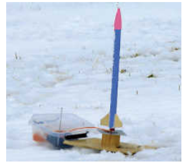
Der Countdown läuft!

Eine andere Gruppe baute sich Raketen. Auch hier mussten die Teile vorher sorgfältig gerichtet werden. Viele Kinder malten ihr Flugobjekt auch noch bunt an. Mit einem ungefährlichen Treibsatz konnten sie nun zur allgemeinen Begeisterung ihre Rakete in die Luft schießen.