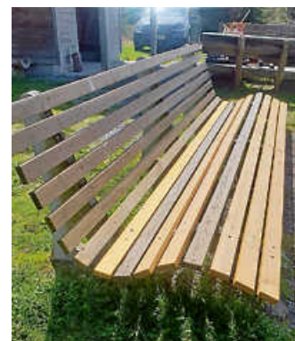
Reparierte Relaxliege an der Michelsrankhütte.

Auch im Bereich „Großes Loch“ war der Einsatz des Bürgerclubs gefragt. Dort war ein Baum umgestürzt und versperrte den Weg. Die Mitglieder arbeiteten das Holz fachgerecht auf, sodass der Weg nun wieder uneingeschränkt passierbar ist.