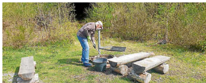
Reinigung der Grillstelle an der Michelsrankhütte.

Mit großem Engagement und praktischem Einsatz hat der Loffenauer Bürgerclub am vergangenen Donnerstag erneut zur Pflege und Instandhaltung wichtiger Einrichtungen und Wege im Gemeindegebiet beigetragen.