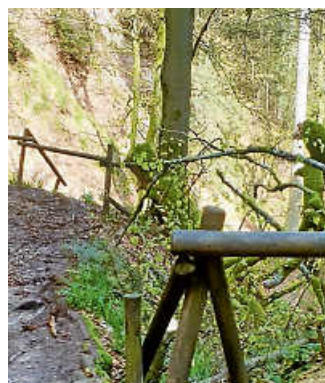
Aufgearbeiteter Baum im Bereich „Großes Loch“.

Im Rahmen des Arbeitseinsatzes wurden mehrere Maßnahmen erfolgreich umgesetzt: An der Michelsrankhütte wurde eine Relaxliege repariert und die dortige Grillstelle gründlich gereinigt. Bei den Laufbachwasserfällen tauschten die Helfer die Querhölzer an den Treppenstufen aus und sorgten damit wieder für einen sicheren und gut gehbaren Weg.